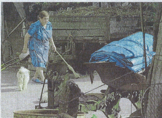
La propietaria de Kukullaga, ayer en su caserío.

"La solución adoptada para evitar el desahucio es fruto del trabajo social continuo"